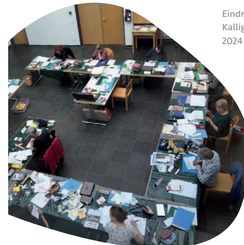
Eindrücke aus dem Kalligraphie-Kurs 2024